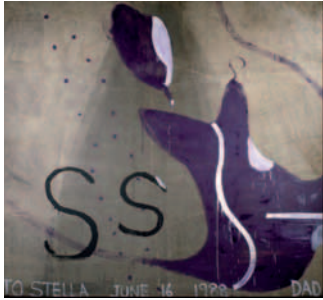
To Stella , 1988 Huile, plâtre sur bâche imperméabilisée Collection Nina Baier, Zurich