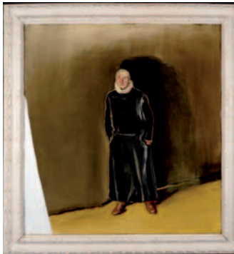
Portrait of José Ramón Antero , 1997 Huile, résine, peinture-émail sur toile Collection privée